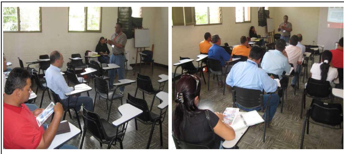
Fotos 1 y 2. Apertura y presentación del proyecto.