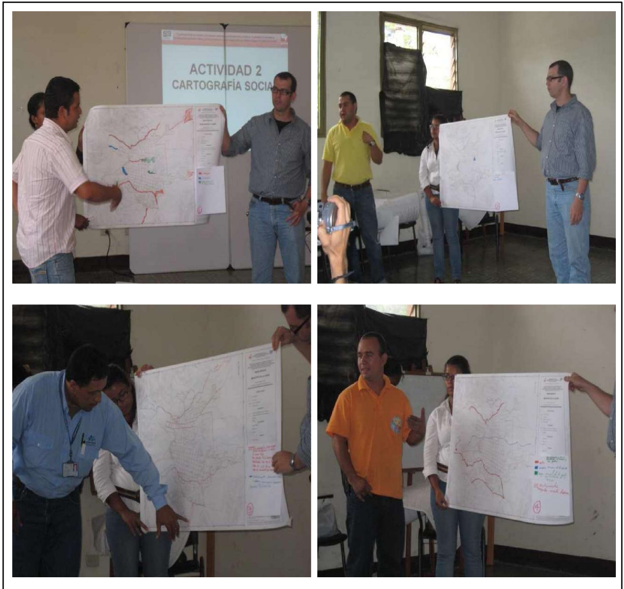
Fotos 7 a 10. Presentación de mapas ejercicio de cartografía social.

Una vez elaborados los mapas, un representante de cada grupo hizo la presentación en plenaria, en este espacio se pudo establecer el nivel de comprensión que la población tiene de la problemática que enfrenta el municipio relacionada con la susceptibilidad a la ocurrencia de fenómenos de remoción en masa e inundaciones. (Fotos 7 a 10).