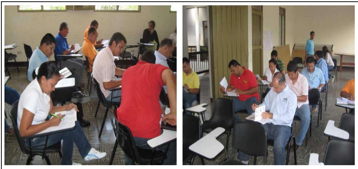
Fotos 3 y 4. Actividad No 1 de la cartilla. Solución de crucigrama.

Después de presentar el proyecto y aclarar los principales conceptos involucrados en el desarrollo del mismo, los participantes con la orientación del equipo de socialización procedieron a desarrollar la actividad No 1 de la cartilla correspondiente a la evaluación de comprensión de conceptos tales como amenaza, vulnerabilidad, riesgo y todos los relacionados con movimientos en masa e inundaciones. Esto se llevó a cabo mediante la solución de un crucigrama, el cual estaba consignado en las páginas 11 y 12 de la cartilla, tal como se aprecia en las (Fotos 3 y 4).