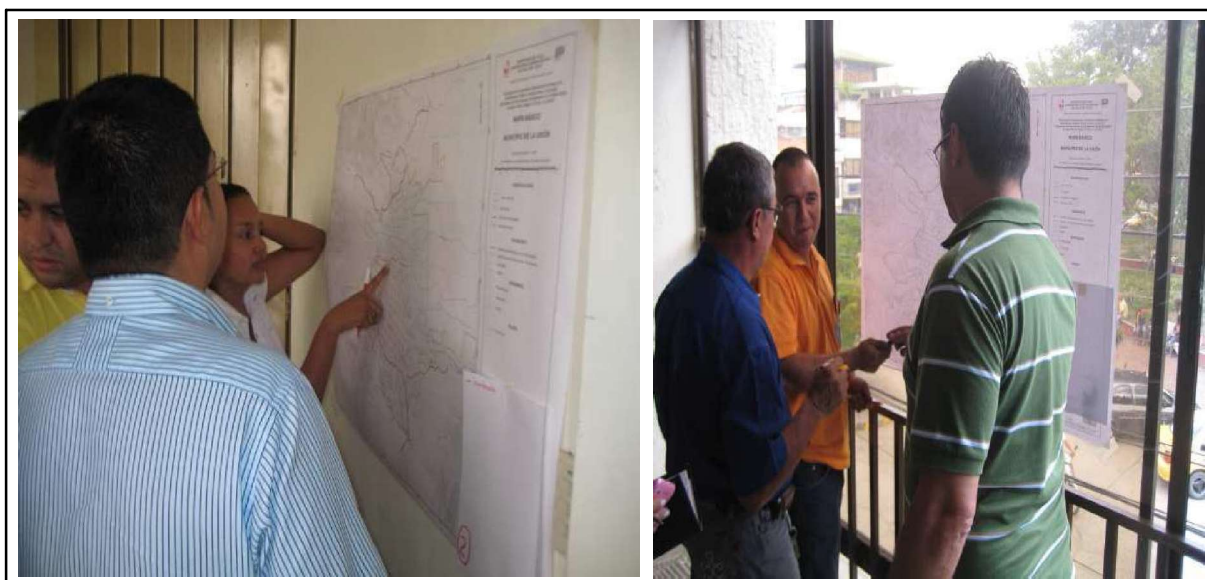
Fotos 5 y 6. Actividad No 2. Cartografía Social.

Con la intención de conocer la percepción y experiencias de los actores sociales participantes en el taller acerca de las zonas de afectación en el municipio, se procedió a realizar la cartografía de zonas de afectación o riesgo correspondientes al municipio de La Unión, mediante un ejercicio de cartografía social. Se organizaron 4 grupos y a cada uno se les entregó un mapa base del municipio, lápiz, marcadores y hojas en blanco, el objetivo era que discutieran sobre las zonas que ellos, desde su percepción y experiencia identifican como posibles escenarios de afectación o riesgo. Cada grupo debería representar dichas zonas en el mapa y elaborar sus propias convenciones, para ello deberían considerar las preguntas orientadoras de la página 15 de la cartilla. (Fotos 5 y 6).